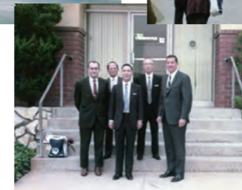
リットン社「チェンペヤー」技術提携