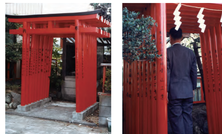
昭和63年 江ヶ崎本社 鳥居更新