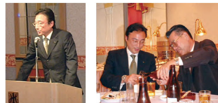
平成14年 社長就任披露宴