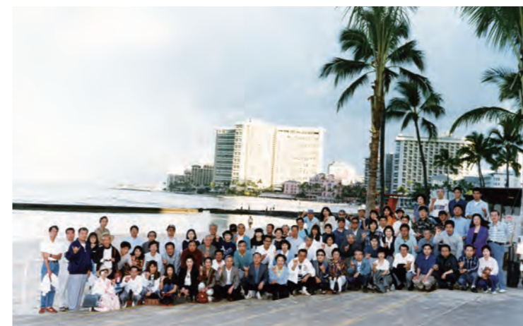
平成7年 創立30周年記念旅行 ~ハワイ~