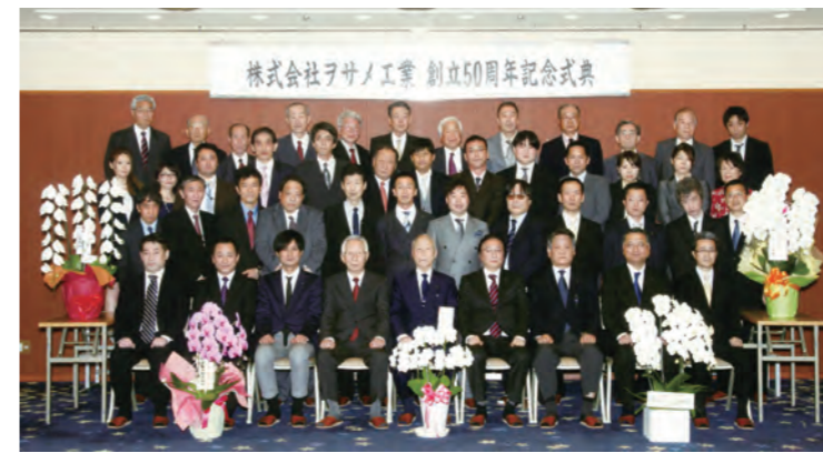
平成27年 創立50周年記念式典