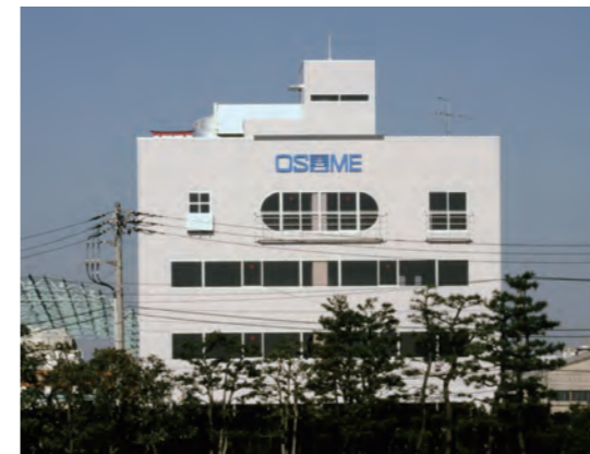
鳥浜本社 (平成7年~現在)