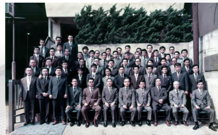
昭和50年 創立10周年記念