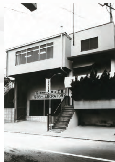
江ヶ崎本社 (昭和41年~平成元年)