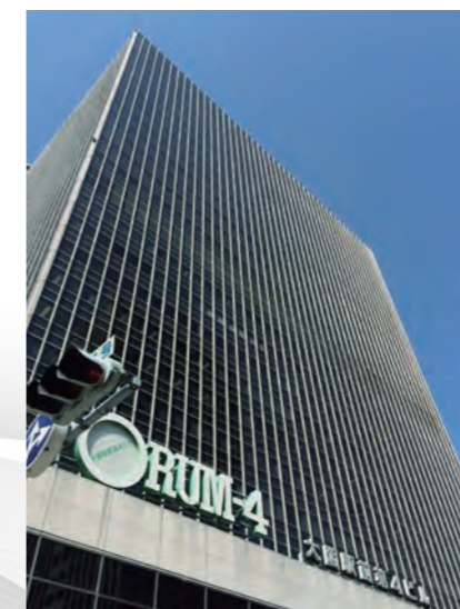
大阪支店 (昭和57年~現在)