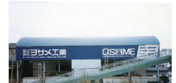
磯子工場 (昭和54年~現在)