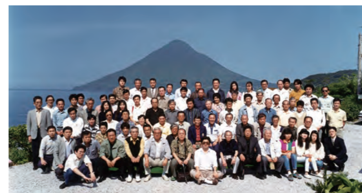
平成3年 創立26周年記念旅行 ~長崎~