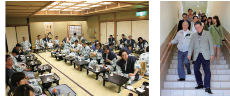
平成29年 創立52周年記念旅行 ~箱根~