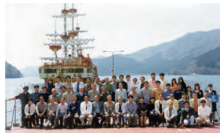
平成9年 創立32周年記念旅行 ~箱根~