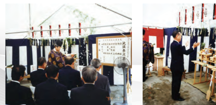
平成6年 鳥浜本社 地鎮祭