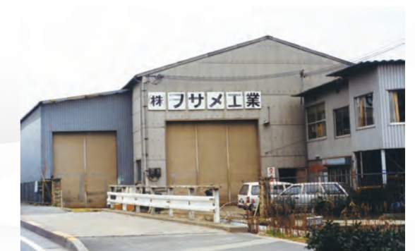
大東工場 (昭和48年~昭和57年)