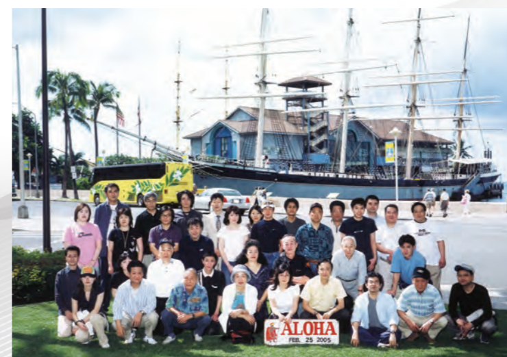
平成17年 創立40周年記念旅行 ~ハワイ~