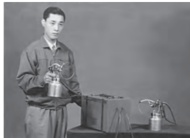
世界初の手動式静電塗装機