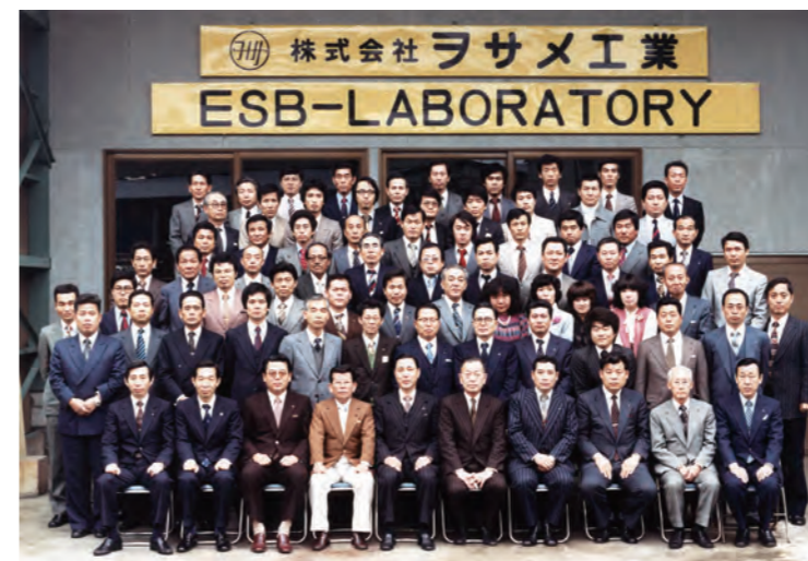
昭和55年 創立15周年記念