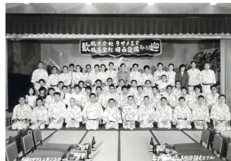
昭和47年 合併記念旅行

横浜商工会議所 議員 昭和57年就任、平成14年退任 終生議員待遇 横浜信用金庫 総代 平成17年選任、現在に至る 鶴見税務署表彰 平成1年11月 平成2年10月 平成4年11月 優良法人の表敬 平成6年5月